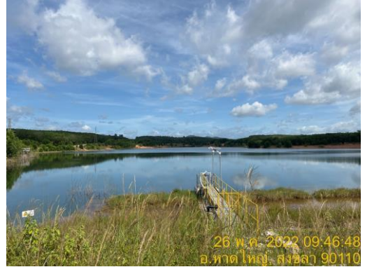
อ่างเก็บน้ำดิบแห่งที่ 2 (ความจุ 1,600,000 ลบ.ม.)