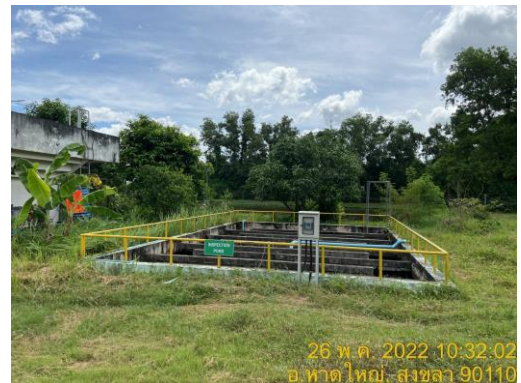
รูปที่ 3 ระบบบำบัดน้ำเสียส่วนกลางของนิคมฯ