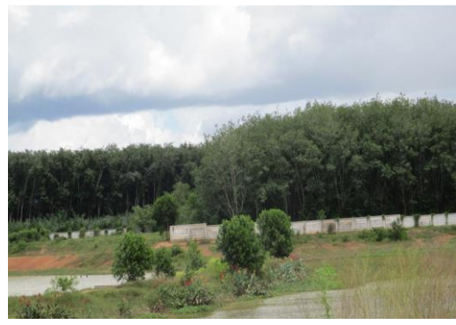
รูปที่ 23 พื้นที่จัดสร้างบ่อหน่วงน้ำในพื้นที่ระยะที่ 3