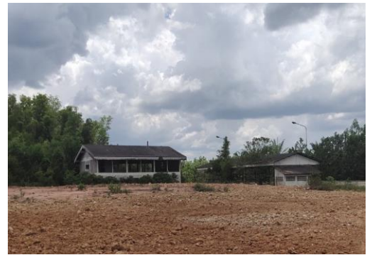
รูปที่ 11 การนำกากตะกอนไปใช้ประโยชน์