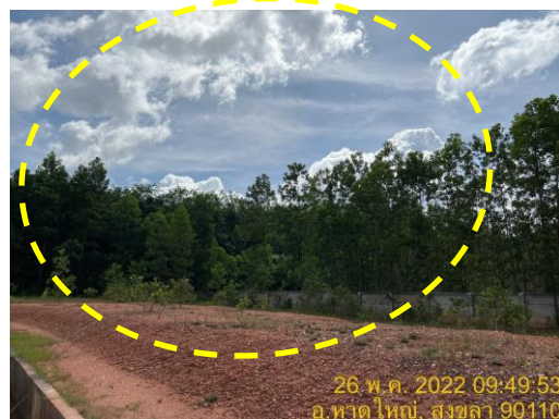
รูปที่ 26 สภาพแวดล้อมโดยรอบพื้นที่นิคมฯ (เป็นพื้นที่สีเขียวและสวนยางพารา)