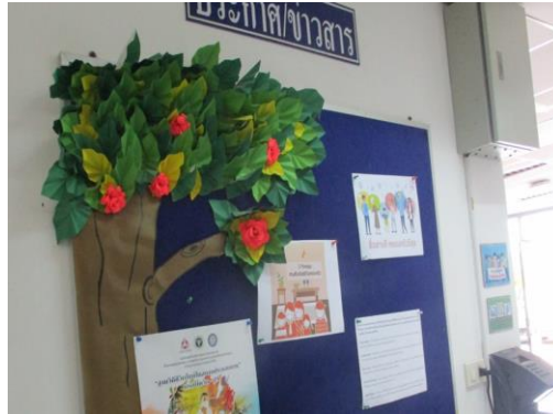
บริเวณสำนักงานนิคมฯ