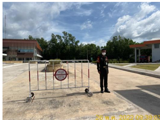
รูปที่ 12 เจ้าหน้าที่รักษาความปลอดภัย