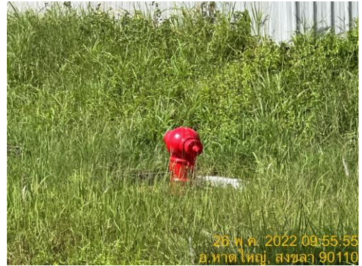
รูปที่ 20 อุปกรณ์ดับเพลิงในพื้นที่โครงการ ทุกๆ 200 เมตร