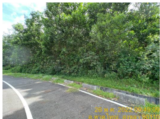
รูปที่ 9 Buffer Zone แนวต้นไม้กันเสียง