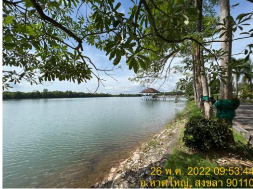
อ่างเก็บน้ำดิบแห่งที่ 1 (ความจุ 1,400,000 ลบ.ม.)