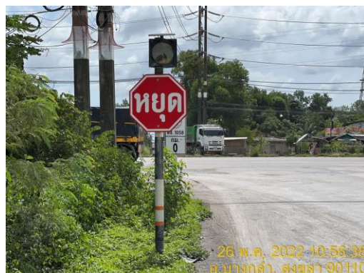
รูปที่ 13 ระบบการจราจร เส้นทางต่างๆ ในพื้นที่โครงการ