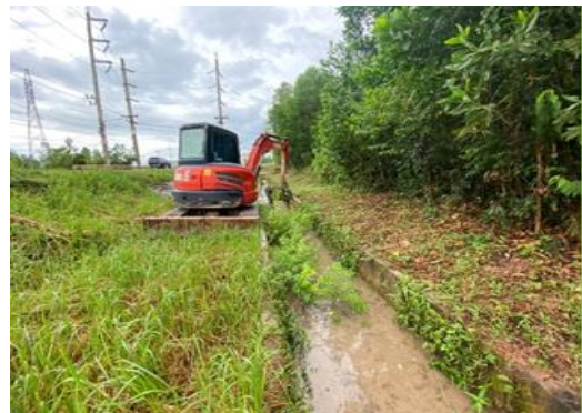
รูปที่ 2 การขุดลอกท่อระบายน้ำเสียและรางระบายน้ำฝนและบ่อฝัง