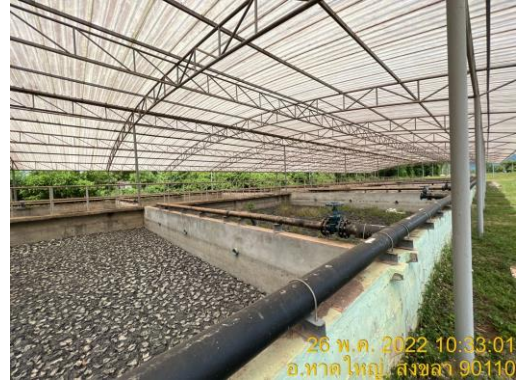
รูปที่ 10 กากตะกอนจากระบบสาธารถูปโภค