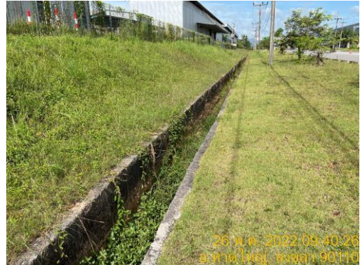
รูปที่ 1 ระบบระบายน้ำฝนของโรงงานและนิคมฯ