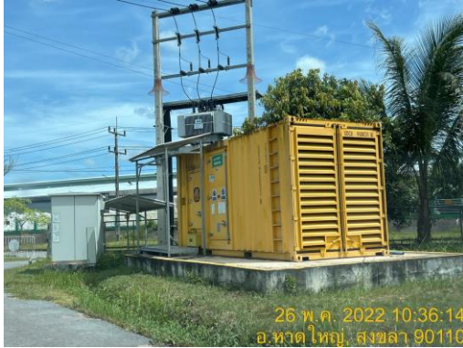
ตู้สำรองไฟ