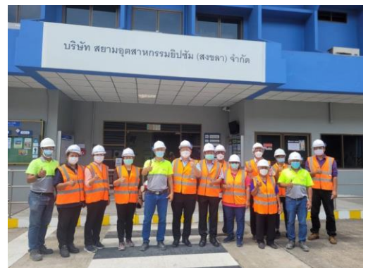
รูปที่ 15 การเยี่ยมชมโครงการ/รชชาวดาวเขี้ยว