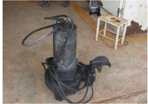
ปั้มน้ำสำรอง