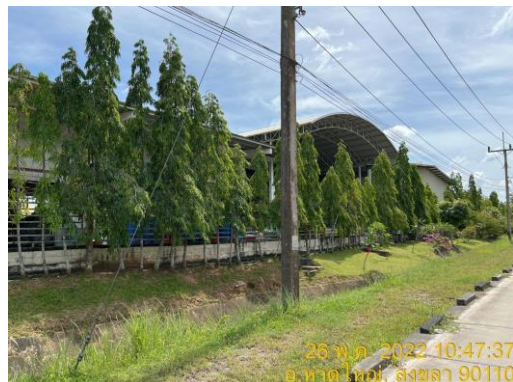
รูปที่ 25 พื้นที่สีเขียวรอบรั้วโรงงานของโรงงานต่างๆ