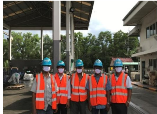
รูปที่ 22 พนักงานสวมใส่ PPE