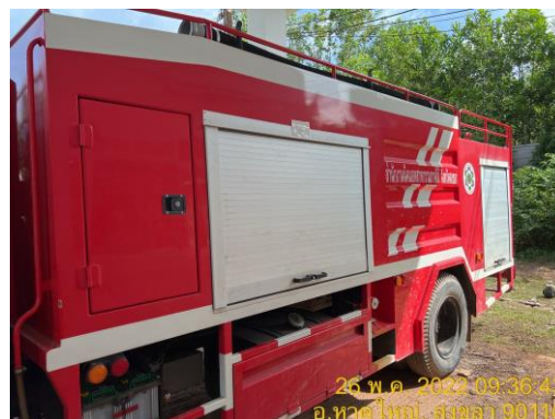
รูปที่ 21 รถดับเพลิงประจำโครงการ