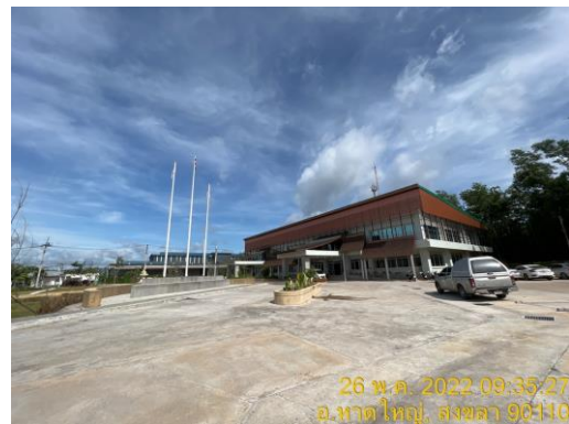
รูปที่ 18 สำนักงานนิคมอุตสาหกรรมภาคใต้ จังหวัดสงขลา