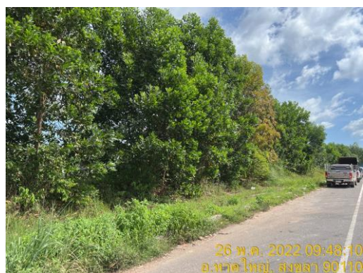
รูปที่ 24 พื้นที่สีเขียวภายในนิคมฯ