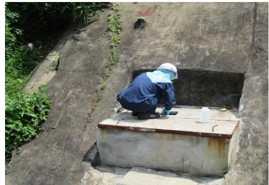
รูปที่ 8 ป่อพักน้ำทิ้งหลังผ่านการบำบัดของโรงงาน