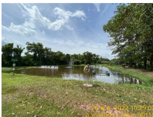
รูปที่ 3 ระบบบำบัดน้ำเสียส่วนกลางของนิคมฯ (ต่อ)