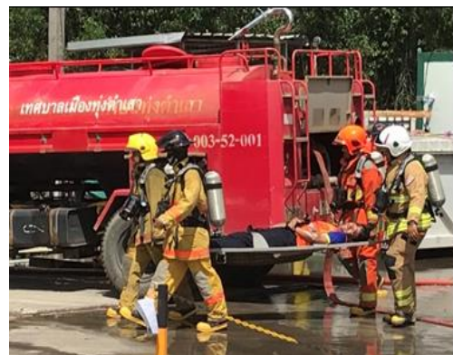
รูปที่ 19 การอบรม/การซ้อมแผนฉุกเฉิน